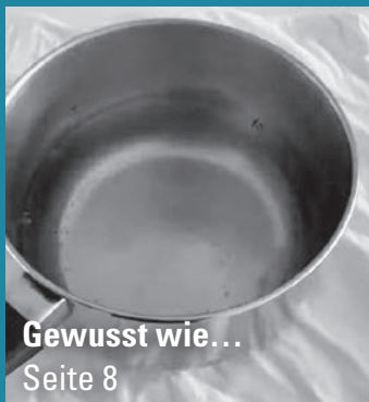
Gewusst wie... Seite 8