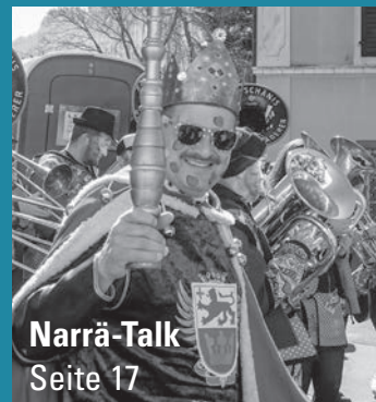
Narrä-Talk Seite 17