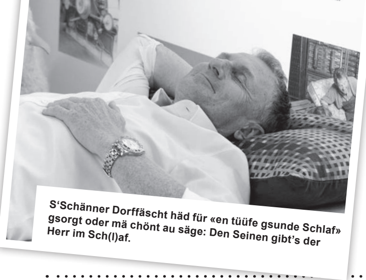
S'Schänner Dorrfäscht häd für «en tüüfe gesunde Schlaf» gsorgt oder mä chönt au säge: Den Seinen gibt's der Herr im Sch(l)af.