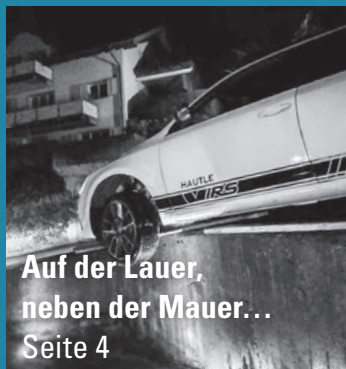
Auf der Lauer, neben der Mauer... Seite 4

An alle Tratschtanten, Plaudertaschen, Zeichner, Autoren und Sponsoren – Herzlichen Dank. Und an alle Leser und Beteiligten, nehmt nicht alles zu genau – sonst gibts in Schänis einen Super-Gau.